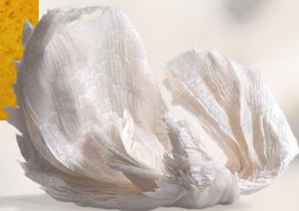
Kinga Földi - "Wings of Memory" © Alida Kovács - 48 x 38 x 38 cm