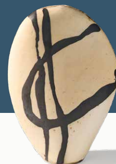
Monika Debus - "Vessel" © Monika Debus - 51 x 33 x 13 cm