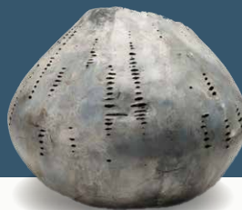
Frédéric Mulatier - "l'ombre du ciel" © Aurélien Lambert - 36 x 38 cm

We nemen met de galerij ook deel aan Kortrijk Art Weekend op 25 en 26 oktober 2025.